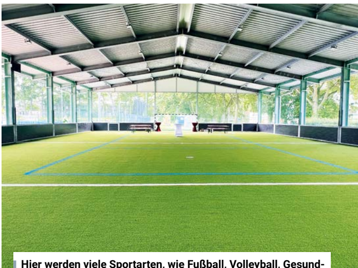
Hier werden viele Sportarten, wie Fußball, Volleyball, Gesundheits- und Reha-Sport stattfinden.