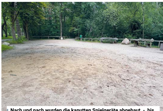
Nach und nach wurden die kaputten Spielgeräte abgebaut - bis nun nichts mehr vom ehemaligen Spielplatz zu sehen ist.

HH-Rissen: Verk. EFH m. Anbau, Haus verm., Whg. frei, ca. 182 m 2 Wfl., Grundst. 1.510 m 2 , 2 Flurstücke, Südgarten, pos. Bauvorbescheid f. Neubau, von privat. KP 1,39 Mio. € VB. ☎ 0174-3089767