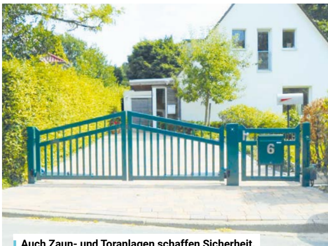
Auch Zaun- und Toranlagen schaffen Sicherheit.

Die Koffer sind gepackt, der Urlaub kann beginnen. Damit die Erholung nicht mit einer bösen Überraschung endet, lohnt sich vorher ein Blick auf das eigene Zuhause. Metallbau Schümann, im Kurzweg 42, in Heist, bietet individuelle Lösungen, um Häuser und Grundstücke besser zu schützen – von hochwertigen Zaun- und Toranlagen bis hin zu maßgefertigten Fenstergittern, insbesondere für Erdgeschoss-, Keller- und Souterrainfenster. Gerade leicht zugängliche Fenster und Grundstücksgrenzen geraten bei Einbrechern häufig zuerst in den Blick. Passgenau gefertigte Fenstergitter und stabile Zaun- oder Toranlagen schaffen zusätzliche Sicherheit und fügen sich gleichzeitig harmonisch in das Gesamtbild des Hauses ein. Statt Lösungen von der Stange setzt Schlossermeister und Schweißfachmann Knut Schümann mit seinem Team auf individuelle Beratung, Planung und Fertigung in der eigenen Werkstatt. Seit 1997 steht Metallbau Schümann für zuverlässiges Handwerk und maßgeschneiderte Metallarbeiten. Von der ersten Idee bis zur Montage kommt alles aus einer Hand – damit Hausbesitzer beruhigt verreisen und sich auch nach der Rückkehr sicher zu Hause fühlen können.