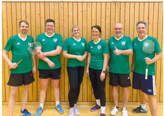
Die Badminton-Teams des RSV blicken auf eine erfolgreiche Saison zurück.

RISSEN. Die Badminton-Abteilung des Rissener SV blickt auf eine sehr erfolgreiche Saison in der Breitensportliga zurück. Von den drei gemeldeten Mannschaften konnten gleich zwei den Sprung in die nächsthöhere Klasse feiern.