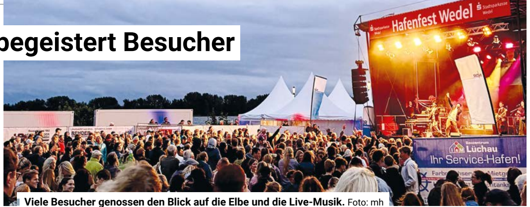
Viele Besucher genossen den Blick auf die Elbe und die Live-Musik.

Mit „Marquess“ stand einer der bekanntesten Acts des diesjährigen Hafenfests auf der Bühne. Viele dürften die deutsch-spanische Band vor allem durch ihren 2007 veröffentlichten Sommerhit „Vayamos Compañeros“ kennen. Der Auftritt lockte die Besucher vor die Bühne und gehörte zu den Höhepunkten des 25. Wedeler Hafenfests. Für viele Gäste steht jedoch nicht allein das Programm im Mittelpunkt. Vielmehr ist das Hafenfest ein Ort, an dem man Freunde und Bekannte wiedertrifft. „Ich finde es großartig, alte Freunde zu sehen. Die After-