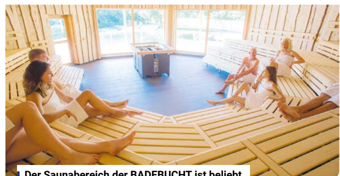
Der Saunabereich der BADEBUCHT ist beliebt.

Weitere aktuelle Informationen sind im Internet unter badebuchT.de zu finden sowie auf facebook.com/badebuchT .