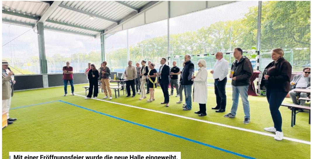
Mit einer Eröffnungsfeier wurde die neue Halle eingeweiht.