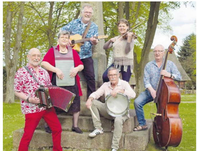
MaCajun verbindet den traditionellen Klang der Cajunmusik mit modernen Einflüssen aus anderen in Louisiana beheimateten Musikrichtungen.

Der Gesang erfolgt überwiegend auf Französisch oder Englisch, gelegentlich auch auf Deutsch – oft mehrstimmig arrangiert. Die Gruppe hat inzwischen fünf CDs veröffentlicht und wurde 2011 in Frankreich als beste europäische Cajunband ausgezeichnet. Viele Auftritte und Sampler-Beiträge – auch gemeinsam mit anderen europäischen Gruppen – haben ihren Ruf in der Szene gefestigt. Die aktuelle Formation besteht seit mehr als zwei Jahren und konnte bereits viele ausverkaufte Konzerte feiern. Zur Besetzung gehören Klaus Haettich (Akkordeon, Mandoline), Ike Deepe (Frottoir, Percus-