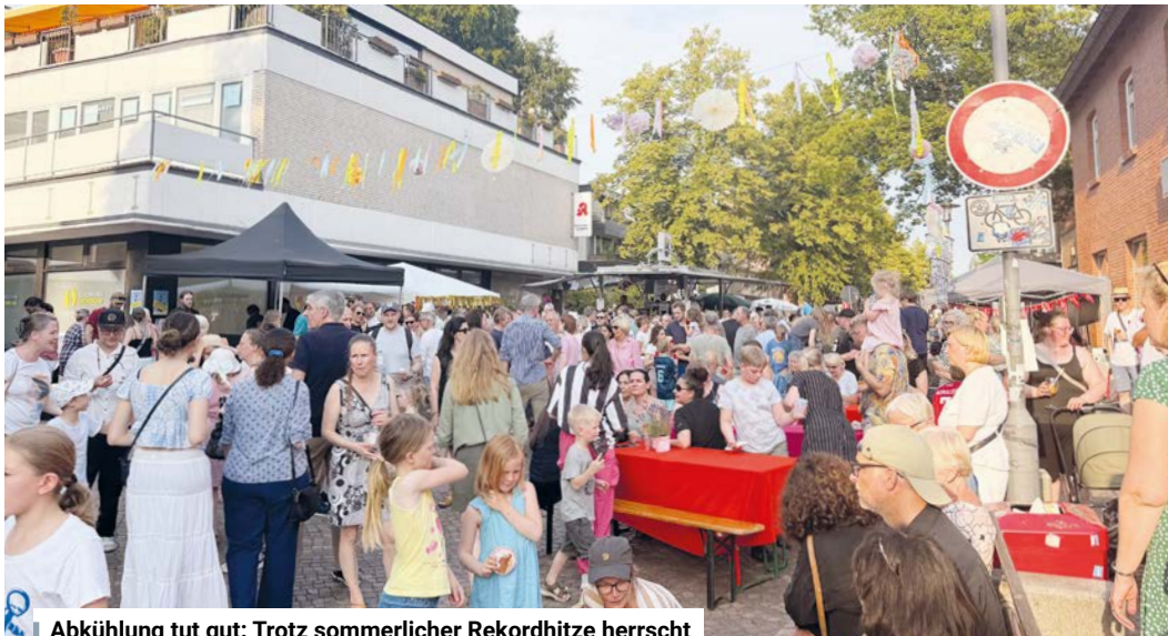
Abkühlung tut gut: Trotz sommerlicher Rekordhitze herrscht beim „Rissener Sundowner“ buntes Treiben.