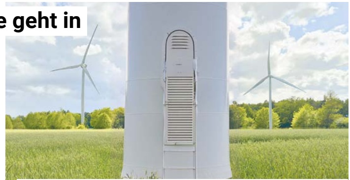
Die Feldmark bleibt im Fokus der Hamburger Windkraftplanung. Ob dort tatsächlich Windräder entstehen, ist allerdings noch offen.

Für die Feldmark Rissen gilt dies bislang nicht. Die Fläche gehört weiterhin zu den Gebieten, die