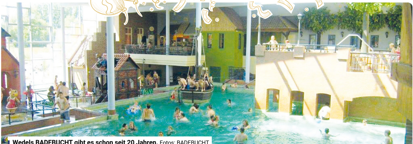
Wedels BADEBUCHT gibt es schon seit 20 Jahren.