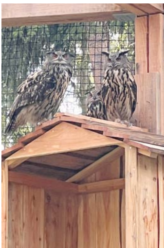
Neugierig schauen die drei Uhus, was in ihrer neuen Voliere vor sich geht.